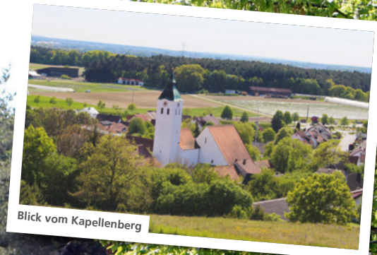
Blick vom Kapellenberg

Gerade die aktuelle Situation während der Corona-Krise zeigt uns, wie wichtig es ist, sich wieder mehr zu seiner Heimat zu bekennen und diese zu unterstützen. Denken Sie bei Ihrem Einkauf doch öfter mal an die kleinen Geschäfte vor Ihrer Haustür, den Bauern im nächsten Ort oder den wöchentlichen Markt in der Innenstadt. Denn Vorteile für regionales Einkaufen gibt es viele: Sie können sich auf eine hohe Qualität und Kontrolle verlassen, schonen dabei die Umwelt, stärken die regionale Wirtschaft und das Wichtigste: Die Produkte schmecken meist besonders lecker.