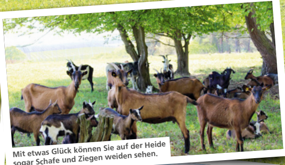
Mit etwas Glück können Sie auf der Heide sogar Schafe und Ziegen weiden sehen.

Am besten parken Sie am Kirchplatz. Richtung Hofcafé Röhl geht es rechts hinauf zum Kapellenberg – von dort aus hat man einen wunderbaren Blick über die herrliche Landschaft. Auf der anderen Seite des Dorfes in Richtung Eining sind auf der rechten Seite wenige Parkeinbuchungen zu finden. Von dort aus sind es nur ein paar Meter zur Sandharlander Heide. Achtung: Bitte nicht von den Wegen des Naturschutzgebietes abweichen.