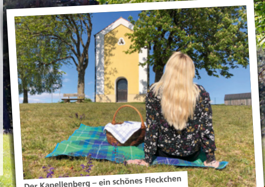
Der Kapellenberg – ein schönes Fleckchen für ein gemütliches Picknick.