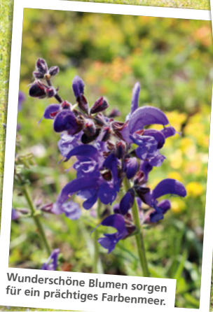
Wunderschöne Blumen sorgen für ein prächtiges Farbenmeer.