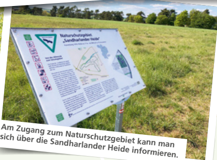
Am Zugang zum Naturschutzgebiet kann man sich über die Sandharlander Heide informieren.