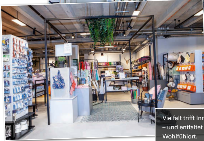
Vielfalt trifft Innenarchitektur – und entfaltet sich zum Wohlfühlort.